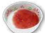
お家でアレンジ簡単！ 牛乳たっぷりプリン