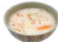
栄養たっぷり！ ミルクトマトスープ

存心館食堂・諒友館食堂 以学館 E-platz ユニオンカフェテリア リンクカフェテリア OIC Cafeteria