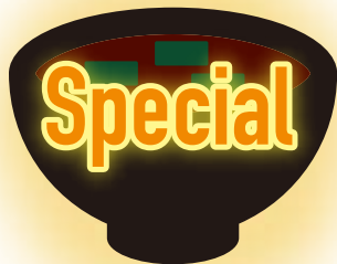
野菜マシマシ具だくさん味噌汁