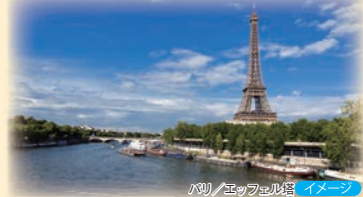
パリ/エッフェル塔 イメージ

コース通りでもよし! 途中で延泊や最終地延泊を加えてもよし! あなたの旅と一緒に考え、お手伝いします! ※3パターン以上は別途見積り手数料が必要。お問い合わせ内容により異なります。