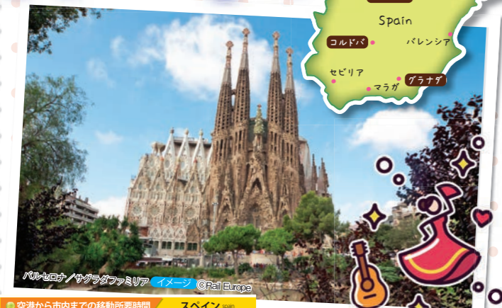
●空港から市内までの移動所要時間

マドリッド (バラハス空港) 約15km エアポート・エクスプレス(バス): アトーチ+車(空港はスベラス広場)まで約30~40分/5ユーロ 地下鉄:ヌエボス・ミニステリオス駅まで約15~20分/4.5~5ユーロ タクシー:市中心部まで約30分/33ユーロ バルセロナ (プラット空港) 約13km 空港バス:カタラーニャ広場まで約30~35分/6.75ユーロ 鉄道:サンツ駅まで約20分/4.6ユーロ タクシー:市内まで約20分/約21ユーロ~+空港チャージ4.5ユーロ(手荷物別料金) ※情報は、2024年9月現在のデータとなります。また日本の所管時間と料金となります。