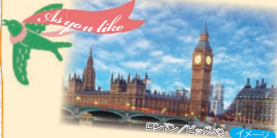
ロンドン/ビッグベン イメージ

空港に着いたら 空港⇄ホテル、鉄道駅⇄ホテル間の移動はご自身で行っていただきます(移動費用は各自負担)。(7ページのヨーロッパお好きな1都市のコースは空港⇄ホテル間の移動は含まれます。)初めてのヨーロッパで、空港⇄ホテル間の移動が不安...という方に 専用車送迎プラン (下記参照)をご用意しました。